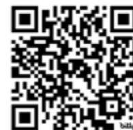
Damen 50 4er