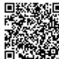
Damen 40 Spielgemeinschaft